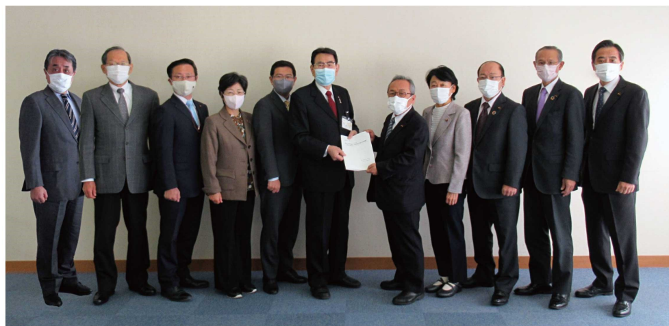
←2021年11月17日花川区長へ要望書を 公明党区議団で提出

今後懸念される第6波に向けて、2回目接種から8カ月を超えた方に対し、3回目接種の無償化実現と接種体制の準備を万全に整えてまいります。また、感染した際の治療法の改善にも全力で取り組みます。