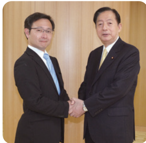
すどうあきお(左)に期待を寄せる 太田前国土交通大臣